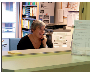
Accueil CMP Marengo

Son équipe vous reçoit sur rendez-vous, en dehors des situations d'urgence. Elle peut également vous informer et vous orienter vers d'autres dispositifs de soins ou d'accompagnement. Pour cela, elle travaille en réseau avec de nombreux partenaires des secteurs sanitaire, médico-social, social, associatif.