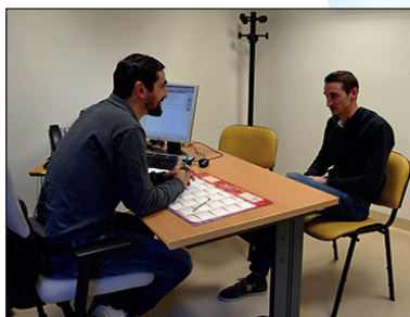
Bureau de consultation - CMP Marengo

→ Quelle orientation peut être envisagée ?