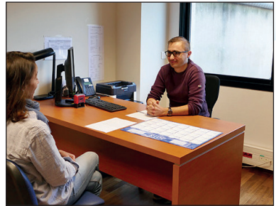
Bureau de consultation - CMP St Michel