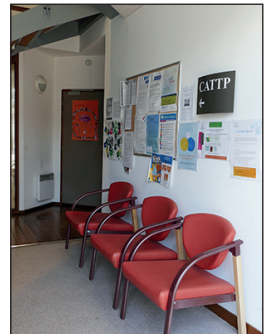
CATTP Saint Michel