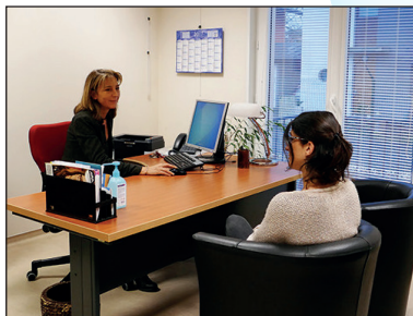
Bureau de consultation - CMP V. Albert

→ Quelle orientation peut être envisagée ?