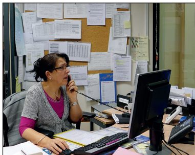
Accueil CMP Villa Albert

Son équipe vous reçoit sur rendez-vous, en dehors des situations d'urgence. Elle peut également vous informer et vous orienter vers d'autres dispositifs de soins ou d'accompagnement. Pour cela, elle travaille en réseau avec de nombreux partenaires des secteurs sanitaire, médico-social, social, associatif.