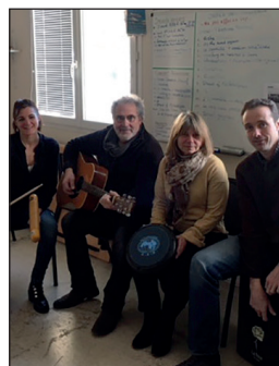
CATTP Villa Albert